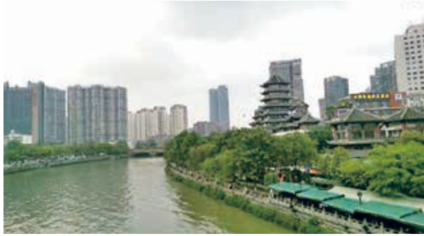
錦江貫穿成都市區

曾任職台商高層20年的陳弘毅認為「各廟宇幕僚的高齡化」可能是沒落的一項指標。建於晉朝的上清宮，則因民國初年重建而保有蔣中正與于右任的墨寶，略添話題。