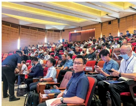
開場前產業界人士陸續抵達