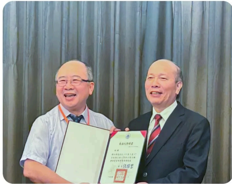
獲聘東海大學榮譽教授

TPS技術創新不是知名大型企業的專利。鉸基是鏈類工具的領導廠商，推動加工、組裝精實有成之後，凸顯了亮漆大噴房的巨大浪費。包括粉體漆回收、清潔與更換，大噴房的換線時間長達40分鐘。鉸基自行開發了大系統小噴房，換線只需調整參數，時間降至3分鐘。這項變革不僅落實單件流、讓WIP減少了92.6%，產能還提升了15.6%。正如同手工具沒有淡旺季，鉸基的精實接單暨生產流程，可趨近於使用顧客的購買暨消費流程，TPS的理想型態，已經隱然若現。